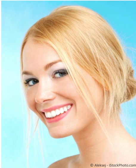
Bleaching vom Zahnarzt: Gewinnendes Lächeln mit strahlend weißen Zähnen

Professionelle Zahnaufhellung durch den Zahnarzt