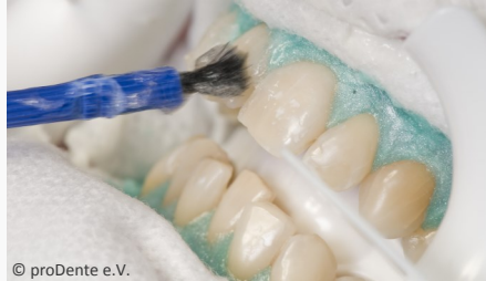
Power-Bleaching beim Zahnarzt: Auftragen des Bleaching-Gels

Wenn Sie die Praxis wieder verlassen, können Sie sich an sichtbar helleren Zähnen freuen!